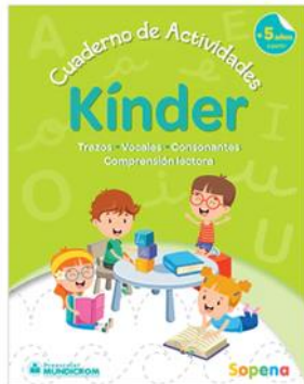
Lenguaje: Cuaderno de actividades Kinder a partir de los 5 años, Sopena.