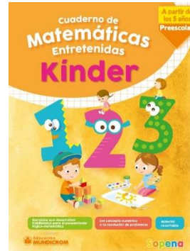
Matemáticas: Cuaderno de matemáticas entretenidas a partir de los 5 años, Sopena.