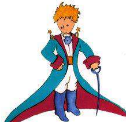
Aquí tienen el mejor retrato que más tarde logré hacer de él

Me puse en pie de un salto como herido por el rayo. Me froté los ojos. Miré a mi alrededor. Vi a un extraordinario muchachito que me miraba gravemente. Ahí tienen el mejor retrato que más tarde logré hacer de él, aunque mi dibujo, ciertamente es menos encantador que el modelo. Pero no es mía la culpa. Las personas mayores me desanimaron de mi carrera de pintor a la edad de seis años y no había aprendido a dibujar otra cosa que boas cerradas y boas abiertas.